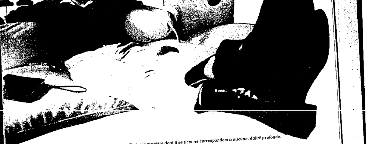
la déconcentration et la confiance en soi que voudrait manifester la manière dont il se tient ne correspondent à aucune réalité profonde.

CP — Quelle est d'après vous l'œuvre la plus importante réalisée par un homme dans toute l'histoire de l'humanité ? BHL — La Bible. CP — Qu'est-ce qui a le plus de valeur pour vous : la Bible ou la vie d'un clochard ? BHL — Silence. CP — Pour sauver la Bible, vous tueriez un clochard ? BHL — Non. Je crois que si l'alternative dépendait de moi ici et maintenant, si j'avais entre mes mains le pouvoir de décider de ce choix diabolique que vous me proposez, je crois que je dirais que la vie d'un clochard est plus importante que la Bible. CP — Croyez-vous en vous ? BHL — Souvent. CP — Croyez-vous aux horoscopes ? BHL — (4 sec.) Je n'arrive pas à me y croire. CP — Croyez-vous en Dieu ? BHL — Ça, c'est une question difficile, je ne peux pas vous répondre en trois mots. C'est une question à laquelle j'ai consacré trois cents pages... de ne crois pas au Dieu personnel, mais je crois que si Dieu n'était pas, la vie ne serait pas vivable. Autant vous dire que ce que j'écris, et mon dernier livre notamment, c'est en fait un corps à corps avec la question que vous me posez, corps à corps éprouvés d'ailleurs. CP — Vous êtes marié ? BHL — Non. CP — Vous n'avez pas d'enfant ? BHL — Si.