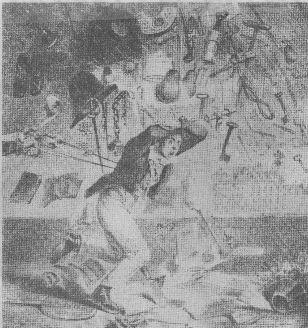
Grandville: "Nijärgåvor till folket".

De gemensamma, övergripande värdena har degraderats till idealistisk metafysik, våra samhällen blir alltmer mångkulturella, den ena kulturyttringen är lika mycket värd som den andra: rock, serier, mode, matlagning är specifika uttryck för kulturell praktik och har i princip samma värde som de stora (konst)verken – "les oeuvres". Den radikala relativism som breder ut sig, tycks Finkielkraut faktiskt mena, är samma andas barn som 1700-talets konservativa kulturfilosofier.