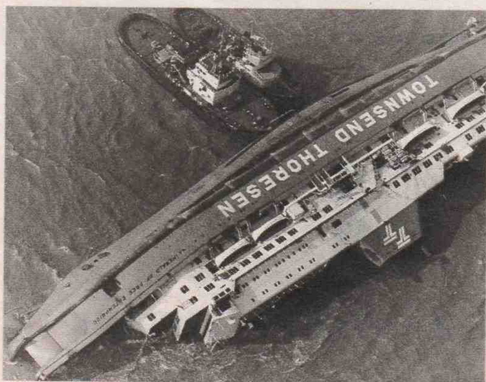
Gekenterte „Herald of Free Enterprise“ in Zeebrugge

Nach dem Zeebrugge-Desaster, bei dem vor vier Jahren fast 200 Menschen starben, beauftragte der britische Verkehrsminister Experten, die Sicherheit der modernen Autofähren zu untersuchen. Ergebnis der jetzt vorliegenden Studie: Die meisten RoRo-Fähren sind instabil.