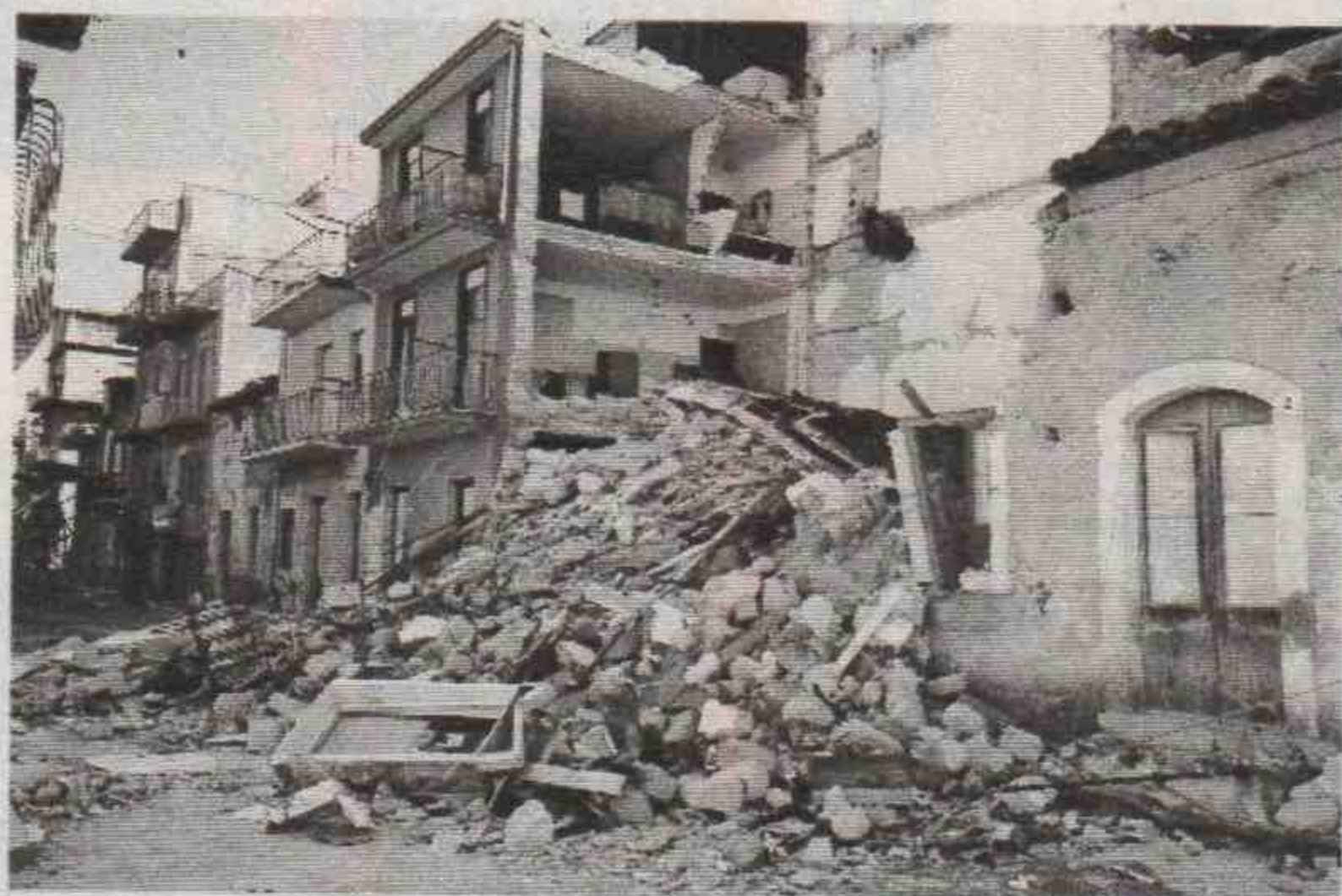
Erdbebenschäden in Italien

Politiker und mafiose Unternehmen machen den großen Reibach mit staatlichen Hilfgeldern für Erdbebengebiete. In rund 20 Jahren hat Rom über hundert Milliarden Mark bereitgestellt – selten nur erreicht die Hilfe die Opfer.