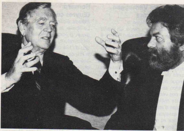
Bertold Beitz (à gauche), vice-président de la Fondation Krupp qui a sauvé pendant la guerre, 800 juifs en Pologne, avec Marek Halter

Et les Purs ?... Chaque jour nous apporte son lot de massacres humains. Bosnie, Algérie, Rwanda... Ici on mitraille, on égorge, là on viole, on découpe à la machette. Des intellectuels, ici, en France, ont réagi, essayant de venir en aide à quelques-uns des leurs menacés de mort (Rushdie, Taslima Nasreen, les journalistes et écrivains algériens...). Leurs moyens ? : les journaux, la télévision, la radio, mais il semble qu'il soit toujours très mal élevé d'utiliser au maximum les divers médias pour tenter de sauver des vies humaines. Encore Bourdieu et Derrida sur Arte !, encore leurs proses dans le Monde , dans Libération ! Et ces agités du Carrefour des littératures européennes, ces colloqueux de Strasbourg ! Les voilà qu'ils dérangent dans leur pesant sommeil les politiques, pour la plupart énormes et inopérants culs de plomb.