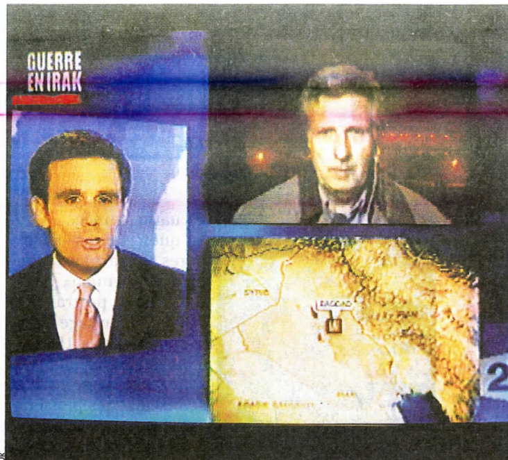
A coups de logos et de techniques commerciales, les journaux télévisés tentent d'attirer le client. Avec succès : une hausse de 7% d'audience...

Effet Vigipirate oblige, la fréquentation des cinémas affiche une baisse de 13 %. Aux Etats-Unis, le 7 e art plonge de plus de 20 %. Seules les comédies tirent leur épingle du jeu de