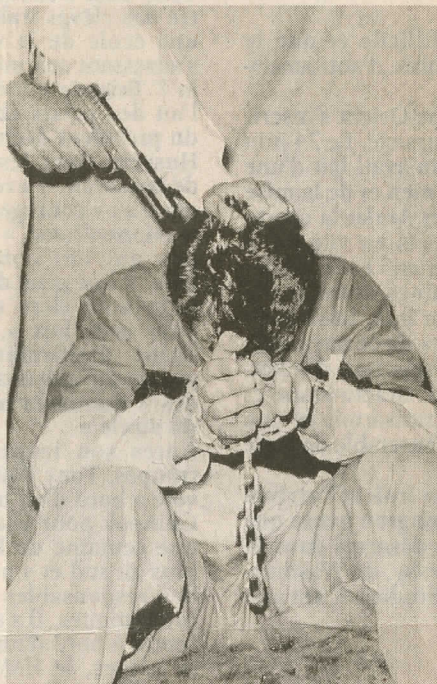
Daniel Pearl.

Le titre du livre de BHL est trompeur. On sait depuis longtemps qui a tué Daniel Pearl. C'est Omar Sheikh, un islamiste pur et dur, d'origine britannique, un combattant du Jihad au Pakistan. « Cerveau » de l'enlèvement et de l'exécution de Daniel Pearl, Omar Sheikh a, depuis, été arrêté par les autorités pakistanaises et condamné à mort par pendaison. Mais pour Bernard-Henri Lévy, il s'agit bien de savoir « pourquoi » on a tué Daniel Pearl. Qui a « vraiment » tué Daniel Pearl, qui a armé le bras d'Omar Sheikh, et quels secrets le journaliste