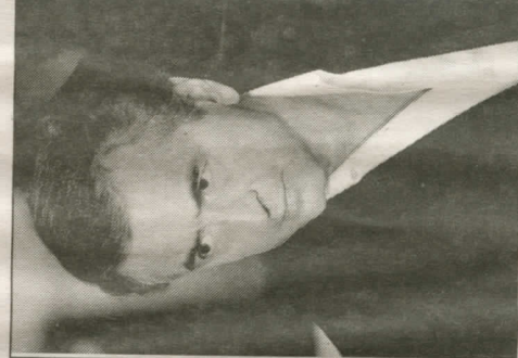
Michel Houellebecq et BHL, le duo des mal-aimés.