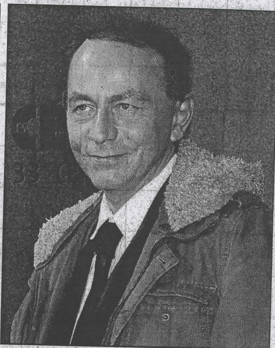
Bernard-Henri Lévy et Michel Houellebecq, complices dans un dialogue d'érudits.

mis publics » autoproclamés se révèlent complices en privé et ces six mois de correspondance, de janvier à juin 2008, ne manquent ni d'émotion, ni de sincérité.